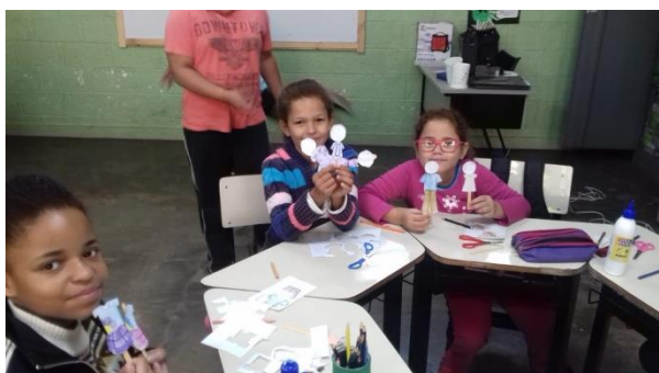
Confecção dos Fantoches