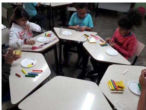
Confeção da família com massinha de modelar