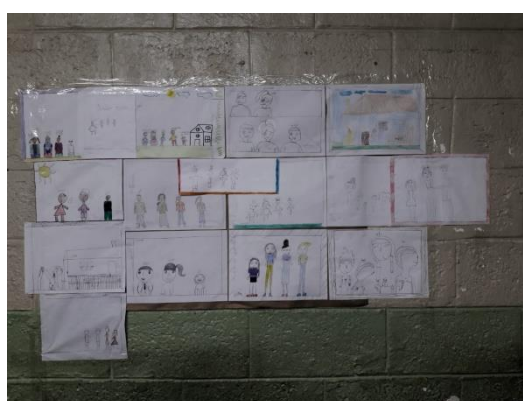
Desenhos da Família