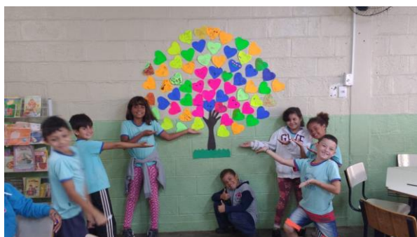
Árvore da Família