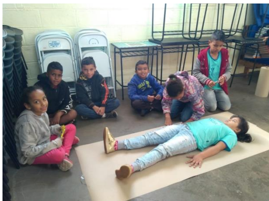
Desenho da Silhueta