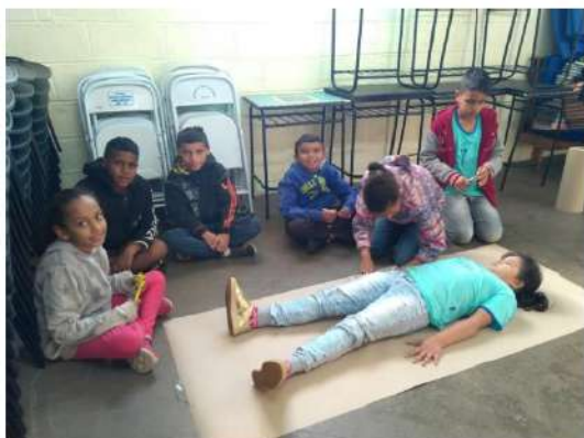
Desenho da Silhueta