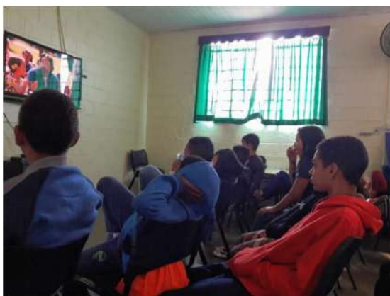
Filme: “Milagre no Paraíso”