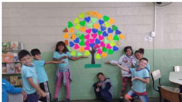
Árvore da Família