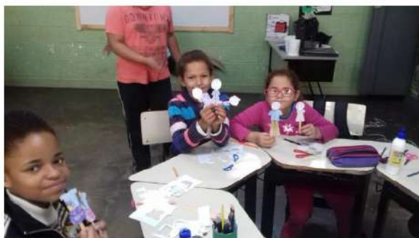
Confecção dos Fantoches