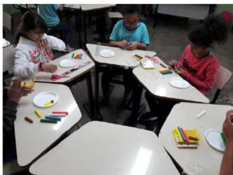
Confeção da família com massinha de modelar