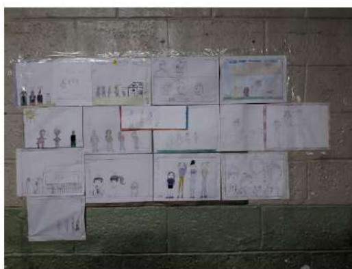
Desenhos da Família