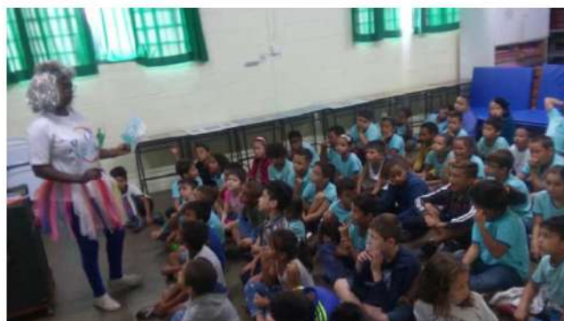
BOM DIA TODAS AS CORES