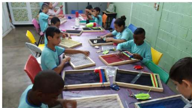
TEAR NO SUPORTE ESPECÍFICO