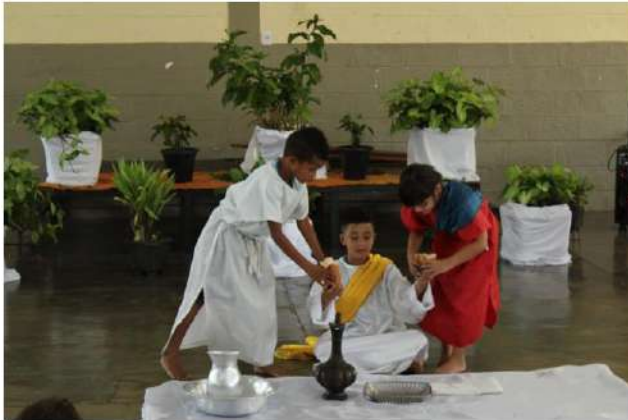
Sala Vermelha – Ceia e Lava Pés