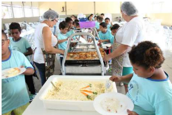
Almoço de Páscoa

Av. José Maria de Almeida Prado nº 265 – Jd Pedro Ometto – Jaú / SP – Fone (14) 3622-3142 CNPJ 50.228.097/0007-58 – Inscrição Municipal 44.475 Utilidade Pública Federal – Decreto 46929/59 Utilidade Pública Estadual – Decreto 33878/58 Utilidade Pública Municipal – Lei 4.044 de 03/07/2006